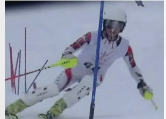
U21 Clément 1er GP District BVAB